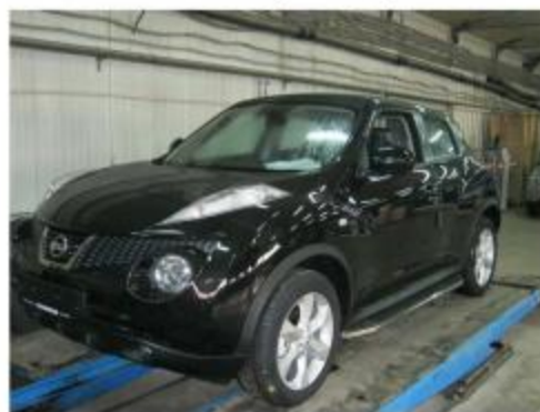
Рис. 7 Вид автомобиля с порогом