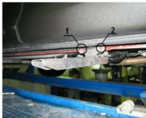
Рис. 4 Места для сверления отверстий