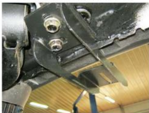
Рис. 6 Установка заднего кронштейна