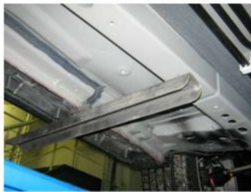
Рис. 5 Установка переднего кронштейна