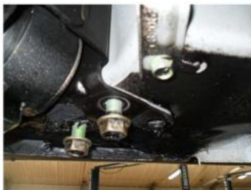
Рис. 2 Место крепления заднего кронштейна