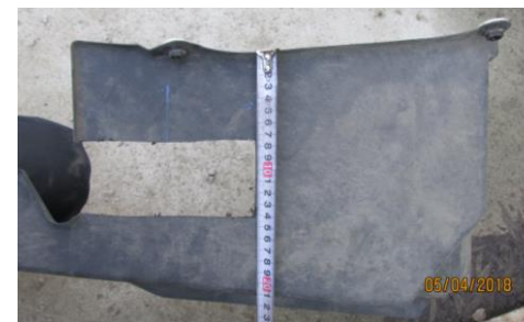
Рис.2 Вырез в левом пыльнике.

4.8. Сделать вырез в левом пыльнике 68х155 мм (см. рис.2).